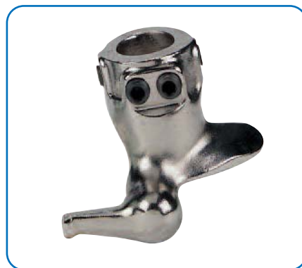
» Tourelle pour roues de moto et scooter

Des pièces telles que les griffes en fusion plus hautes et les zones de blocage interchangeables témoignent de l'attention pour l'ergonomie, la sécurité et l'économie.