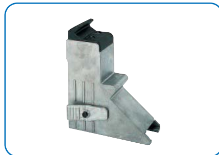
» Griffes pour moto 15"-23"