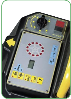
» Panneau de commande intégré avec afficheur numérique et clavier

Pour faciliter le lancement de la roue, le moteur à deux vitesses est équipé d'un joint hydraulique qui permet le lancement graduel sans endommager le flanc du pneumatique.